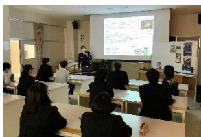
弘前消防依頼内容の説明風景