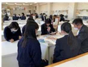
デザイン制作依頼者との打ち合わせ風景

がけ、本校を大いにアピールしようと頑張っています。黒石高校情報デザイン科として、これからも生徒が実社会を意識できるよう、企業や地域社会と連携した取り組みをさせ、創作活動の場を充実したものにしていきたいと考えています。