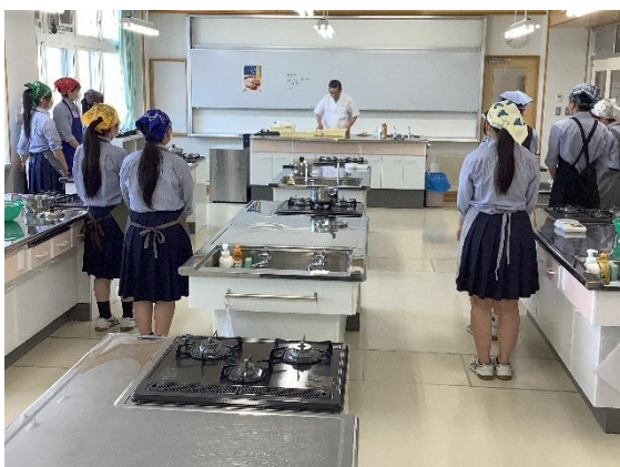
説明を受ける様子