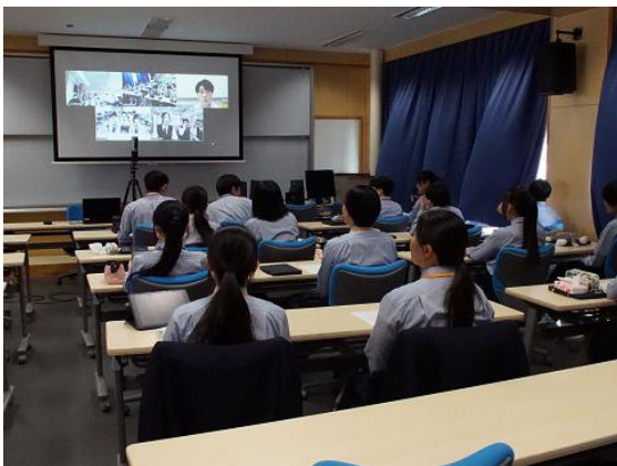
オンラインミーティングの様子