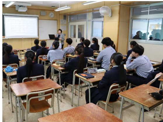
講師による講演を聴いている様子