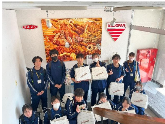
お土産もいただきました