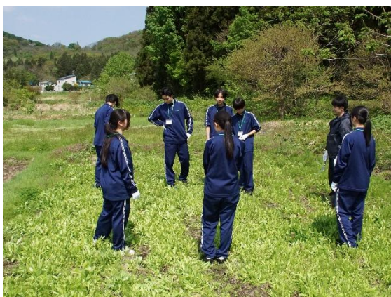
畑についての説明を受ける様子