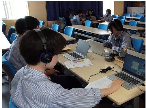
オンラインミーティングの様子