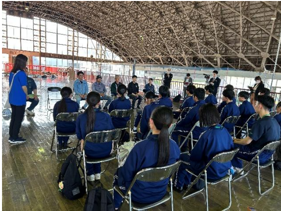
説明を受ける様子