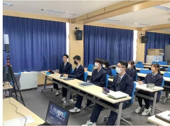
オンラインの様子