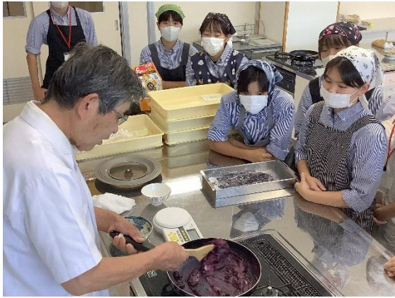
講師の先生の実演