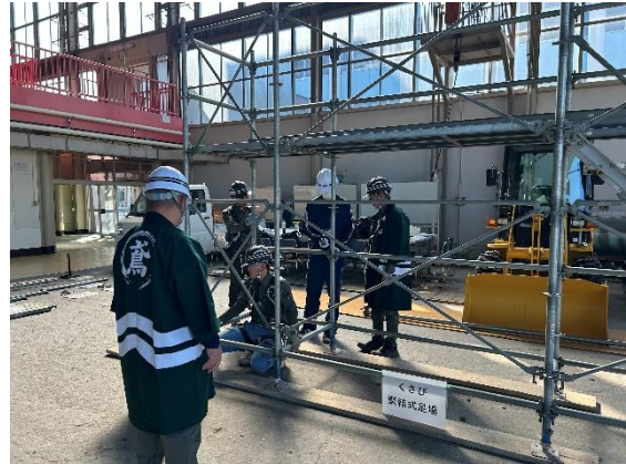
足場組み立てを体験