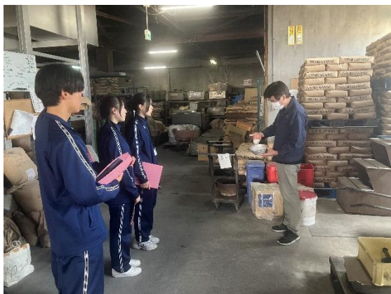
中川工場長より説明