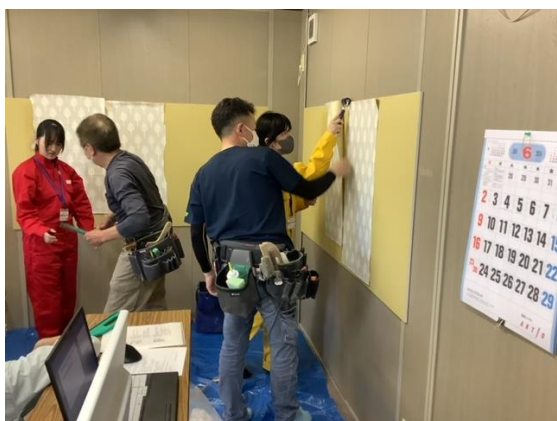
クロスシート貼り体験