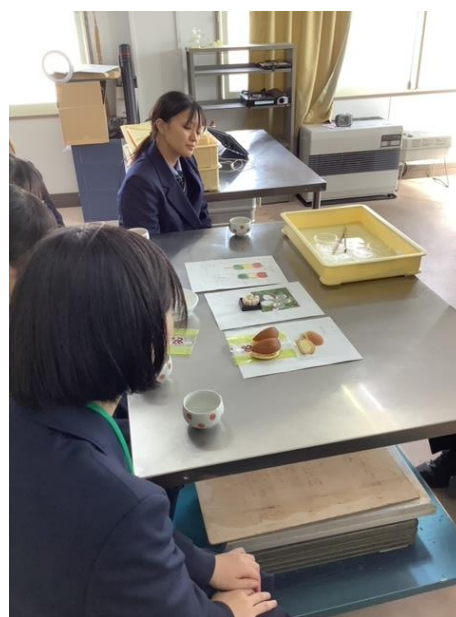
試作品を前にして検討