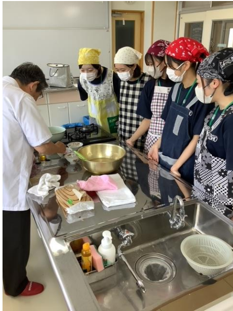
畑中氏より実技指導